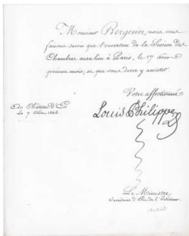
Convocation, signée de Louis-Philippe, roi des Français, de Louis-Catherine Bergevin à l'ouverture de la session des Chambres du 17 août 1846.

Les deux hommes cumulent également les mandats politiques : Louis-Athanase est maire de Blois (1803-1806), Louis-Catherine est conseiller municipal à Blois et à Saint-Gervais-la-Forêt, conseiller général du canton de Bracieux pendant près de 25 ans et préside l'assemblée départementale en 1869-1870. Sa carrière publique marque un coup d'arrêt à la suite de la Révolution de 1848, qui conduit à sa suspension temporaire de la présidence du tribunal.