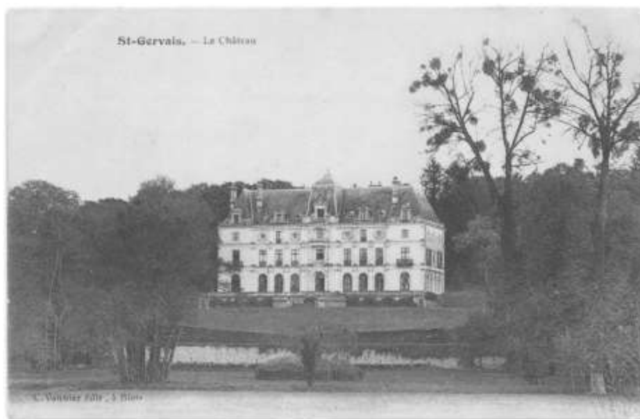
Château de Saint-Gervais, vue générale. Carte postale, C. Vannier éditeur, 1 er quart du XX e siècle. AD41, 6 Fi 212/1

Demeure à la hauteur de la réussite familiale, la construction du château de Saint-Gervais est initiée en 1842 sur la base de l'ancienne maison de la Templerie, sur les plans de l'architecte Jules de la Morandière .