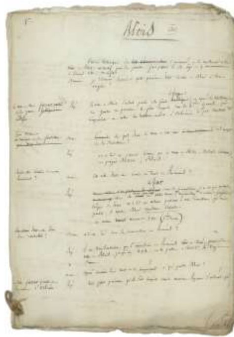
Notes historiques sur Blois de la main de Louis-Athanase Bergevin, 1807