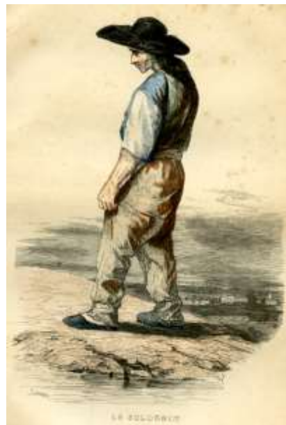
Gravure tirée de la brochure de Félix Pyat Le Solognot , 1841