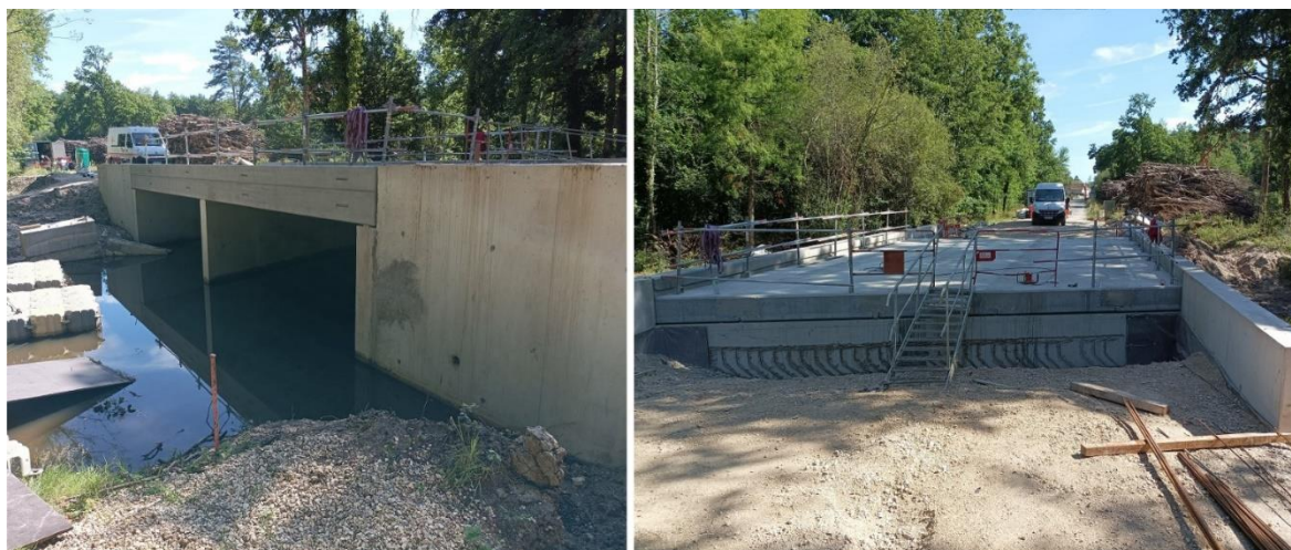
Reconstruction de la buse sur le Naon

Les travaux de reconstruction de la buse prennent fin. La route départementale fermée à la circulation depuis 1 an sera prochainement ouverte ( coût : 570 000 € ).