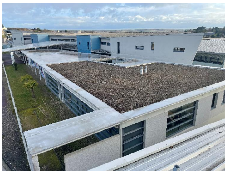
Collège de Saint-Aignan