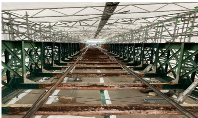
Pont de Châtres, après démolition des voutains

Les réparations de ces deux derniers ouvrages d'art se poursuivent durant tout l'été et s'achèveront d'ici quelques mois.