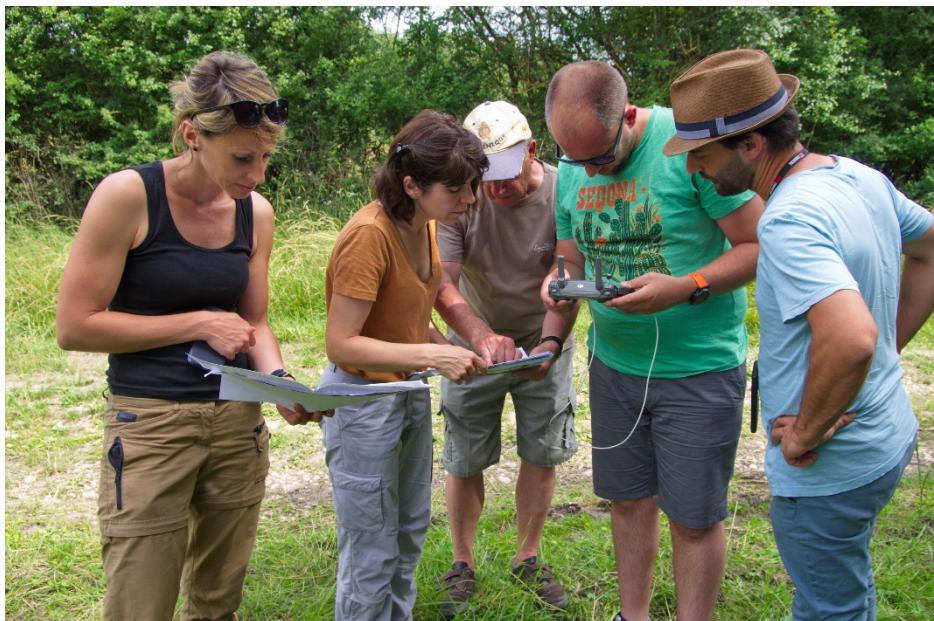
Les prairies de Fouzon