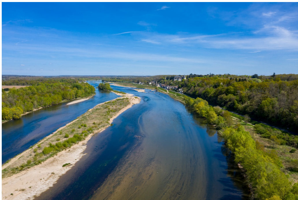
Ile de la folie

Organisateurs : CENs Centre-Val de Loire et Loir-et-Cher – Foyer rural et Mairie de Couffy – Info au 02 47 27 81 03 ou au 02 54 58 94 61