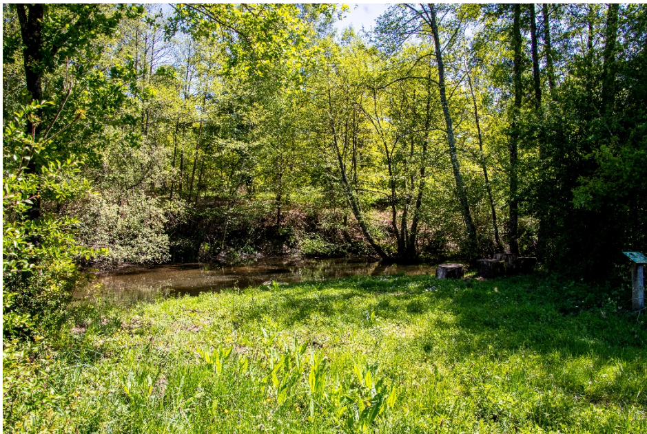
La grande prairie

L'action du département s'est accentuée ces dernières années pour permettre aux écoliers, et aux collégiens particulièrement, d'accéder à ces espaces en étant accompagnés par des éducateurs nature professionnels.