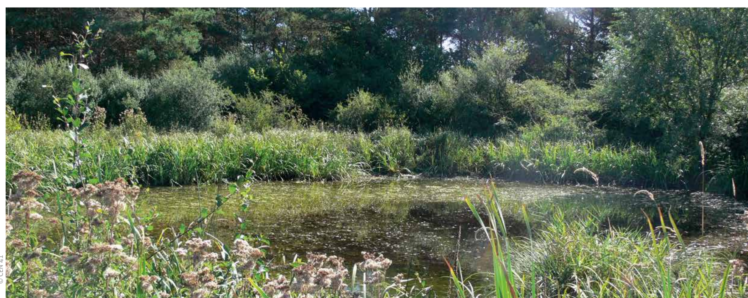
Mare et sa ceinture de végétation aquatique