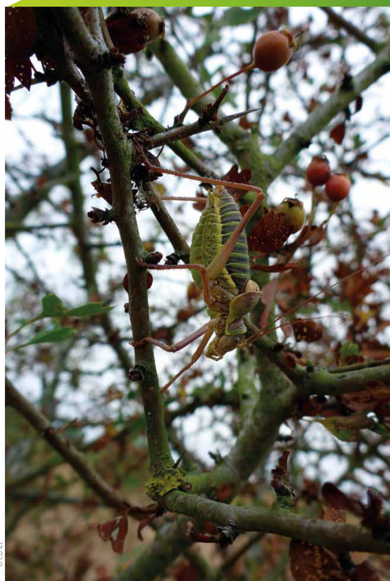
Ephépiger des vignes

Pour connaître les sorties organisées, contactez le Conservatoire d'espaces naturels de Loir-et-Cher au 02 54 58 94 61.