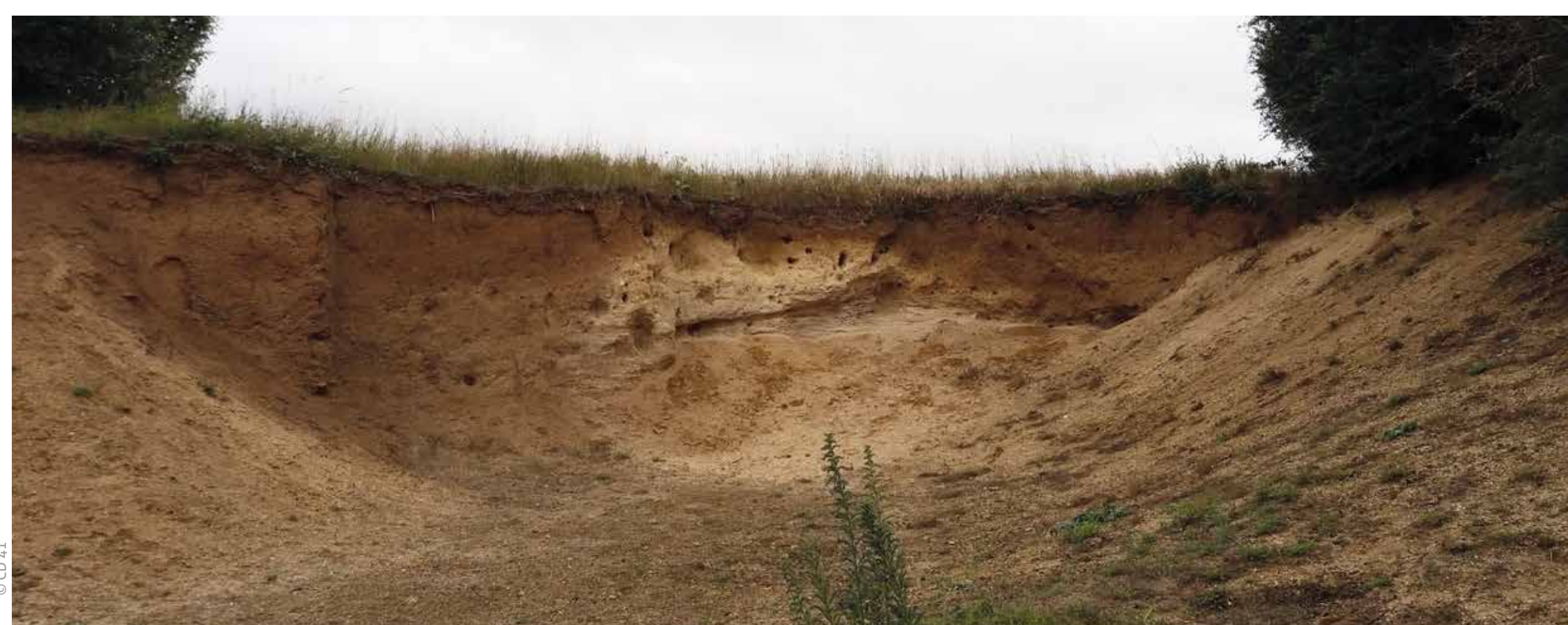
Front de taille