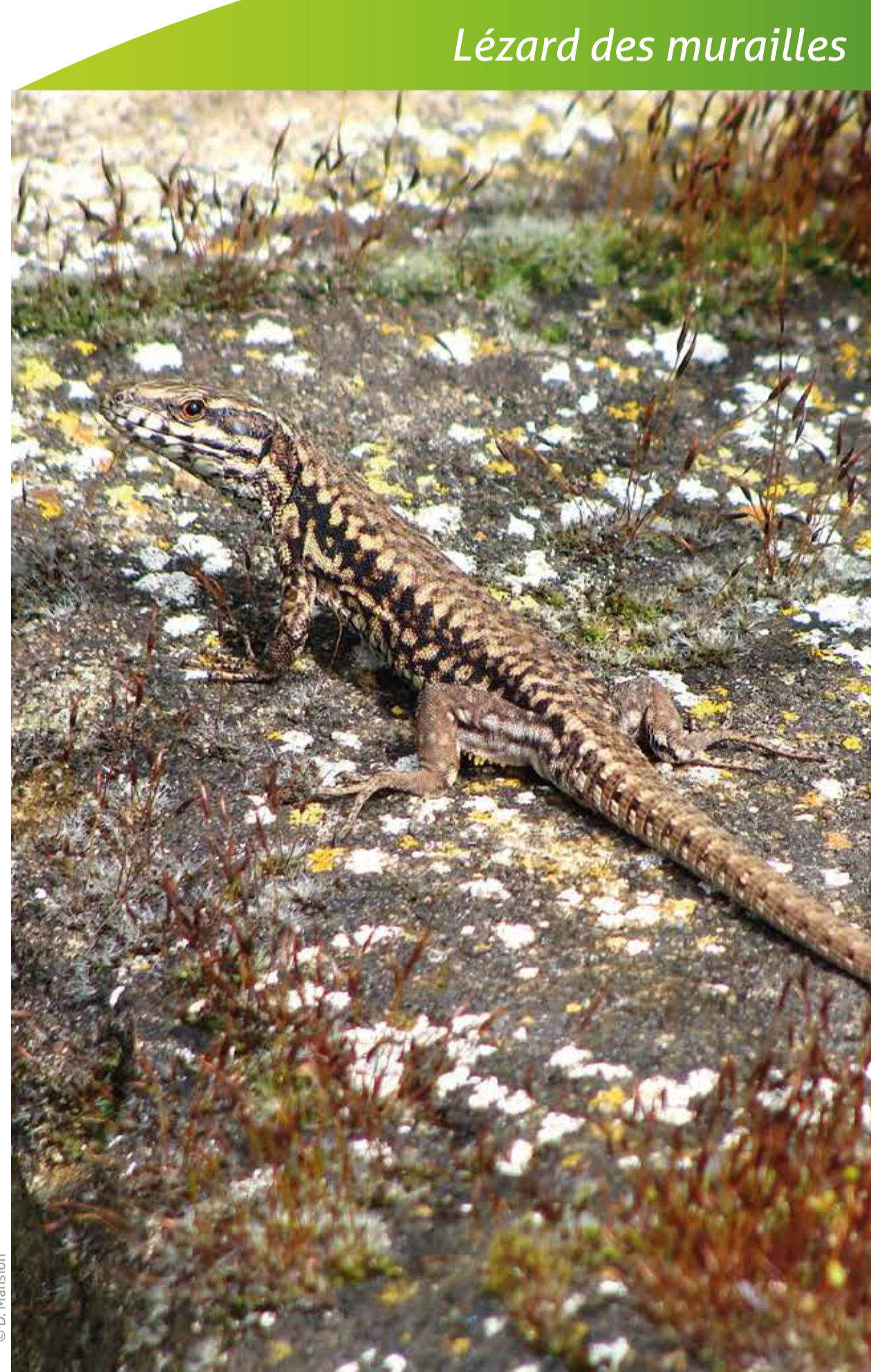
Lézard des murailles

Dans cette ancienne carrière artisanale, située en bordure est du plateau de Pontlevoy, le falun , sable riche en coquilles calcaires, a été exploité. Cette roche, par ses composants et ses structures mises en place par des courants, témoigne de l'existence de la mer il y a seize millions d'années . Particulièrement fertiles, les affleurements de falun contribuent à la diversité paysagère et culturelle de la bordure de cette région très proche de la Sologne occidentale... et viticole.