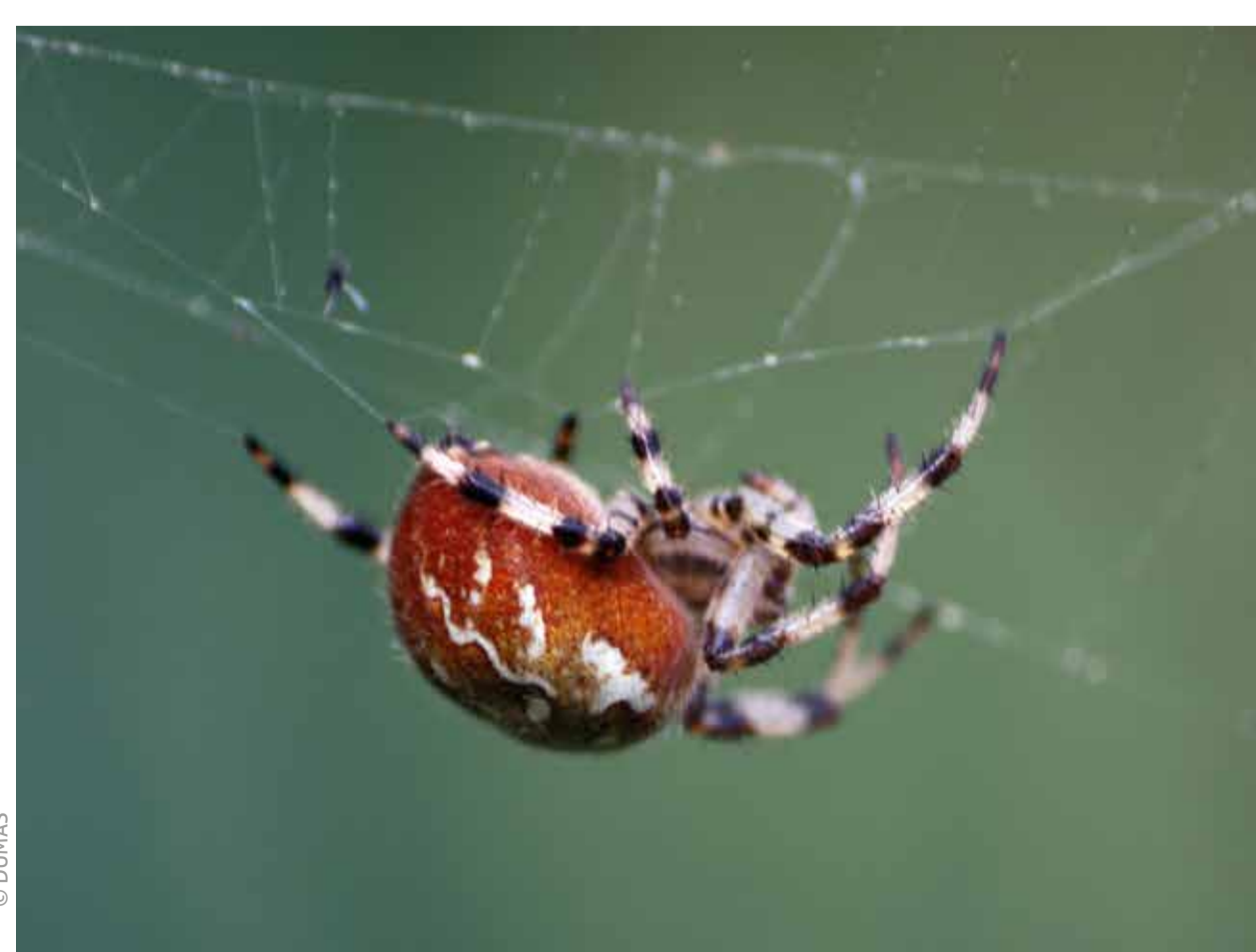
Epeire à 4 points