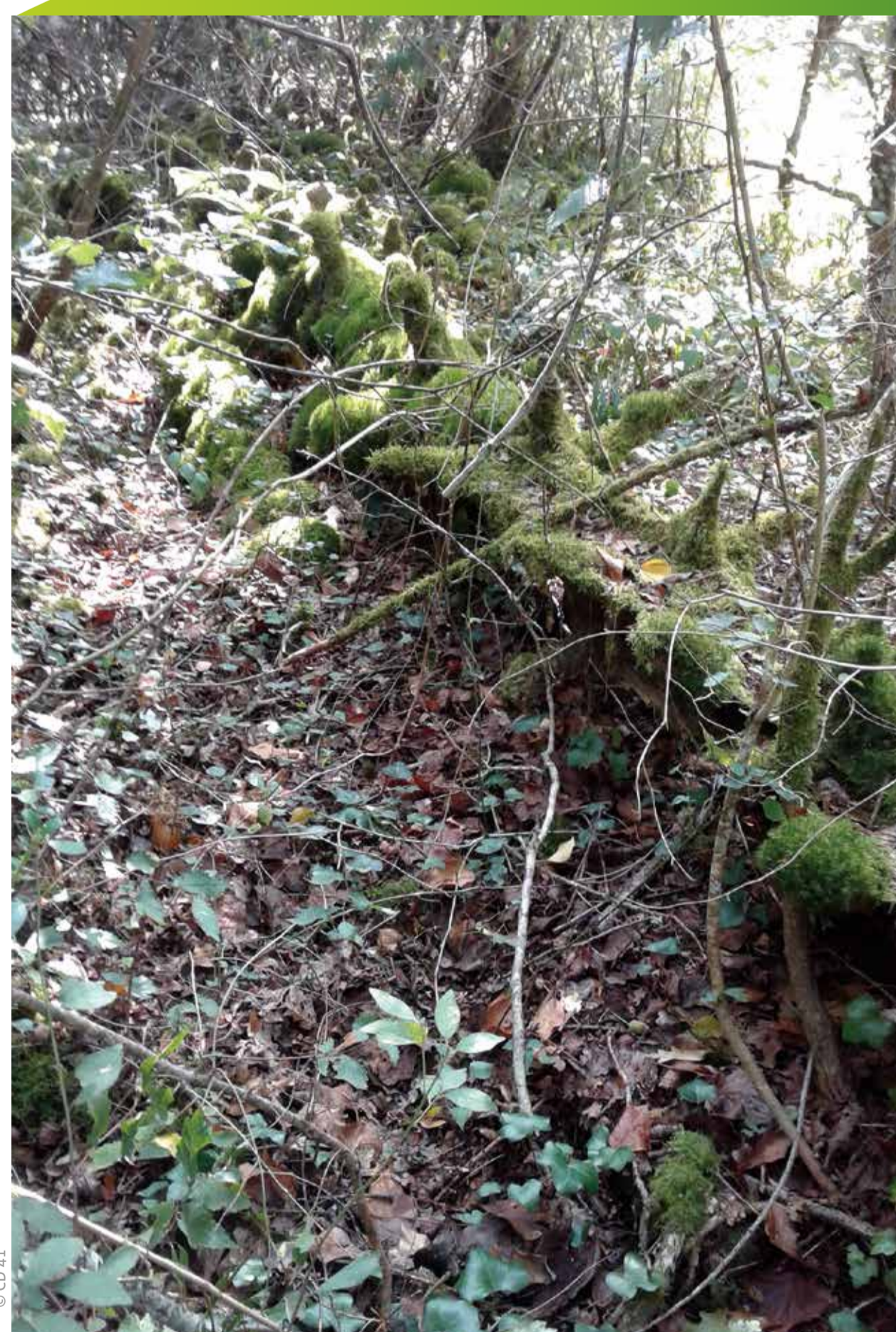
Bois en décomposition couvert de mousse

Unique réserve naturelle nationale en Loir-et-Cher, la mosaïque composée par ses milieux naturels en fait un lieu d'exception. La vallée sèche de la Grand-Pierre, creusée dans le plateau calcaire, apporte un intérêt géologique supplémentaire. La réserve présente d'autres points d'intérêt : archéologique avec la nécropole protohistorique de la Grande-Mesle, artistique avec le parcours créé par l'artiste Michel BLAZY. À Marolles, la Maison de la nature présente une muséographie complémentaire.