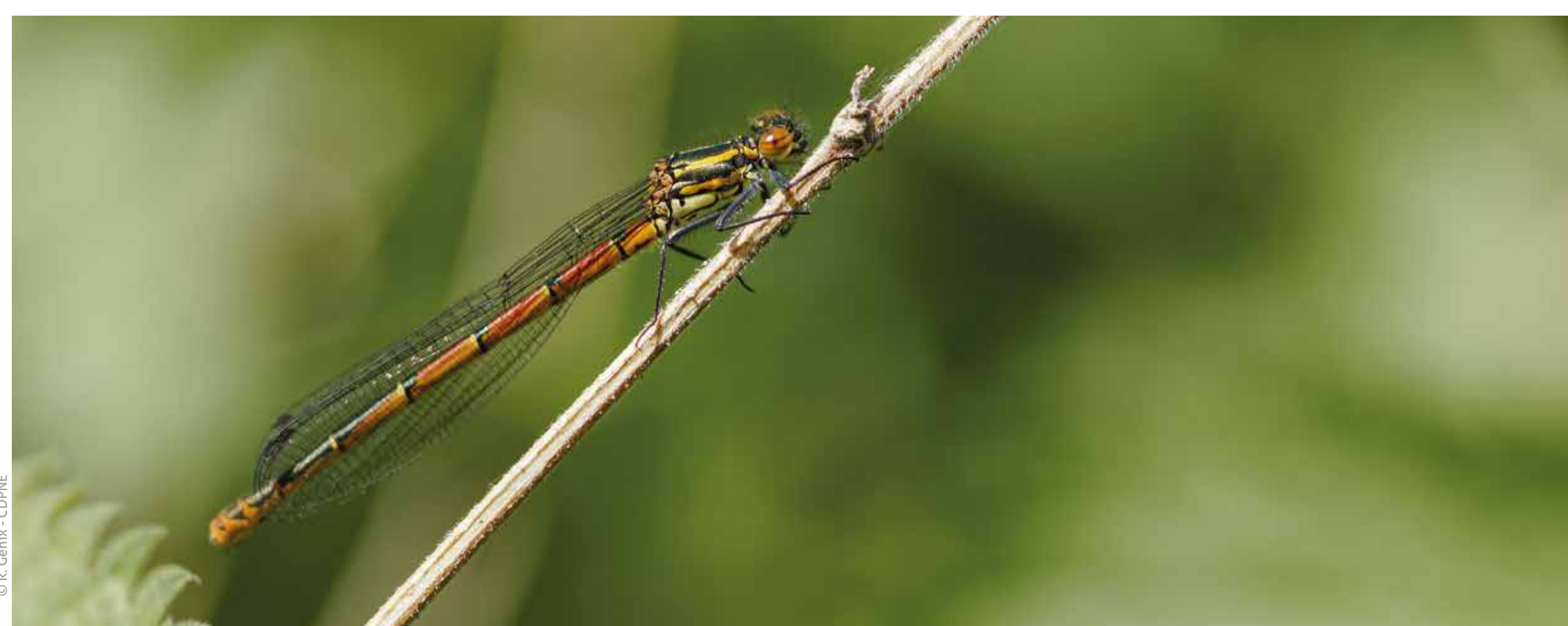
Petite nymphe au corps de feu