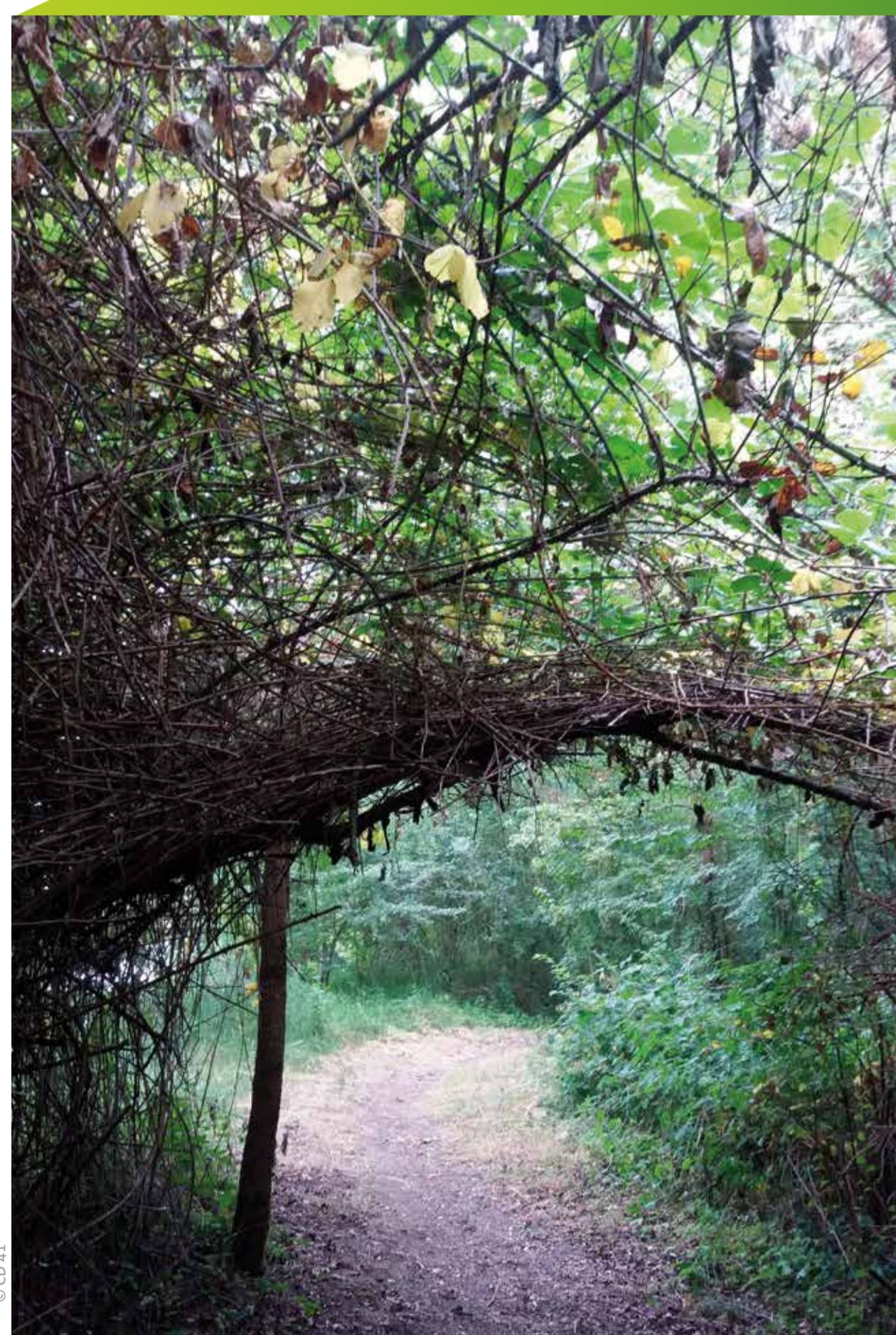
Une voûte naturelle de lianes et de ronces

La vallée de la Loire possède de nombreux espaces naturels préservés , dont l'île de la Folie. La forêt alluviale qu'elle abrite est sans doute l'une des plus proches de la forêt ligérienne que l'on rencontrait autrefois sur ces rives. L'île de la Folie, ainsi que l'île de la Marinière plus en aval, ont été rattachées à la rive gauche du fleuve par colmatage du chenal, résultant des interventions humaines pendant près de deux siècles. À quelques dizaines de mètres en amont de ce site a eu lieu la première réintroduction du castor d'Europe qui, depuis, a reconquis l'ensemble de la vallée et ses principaux affluents.