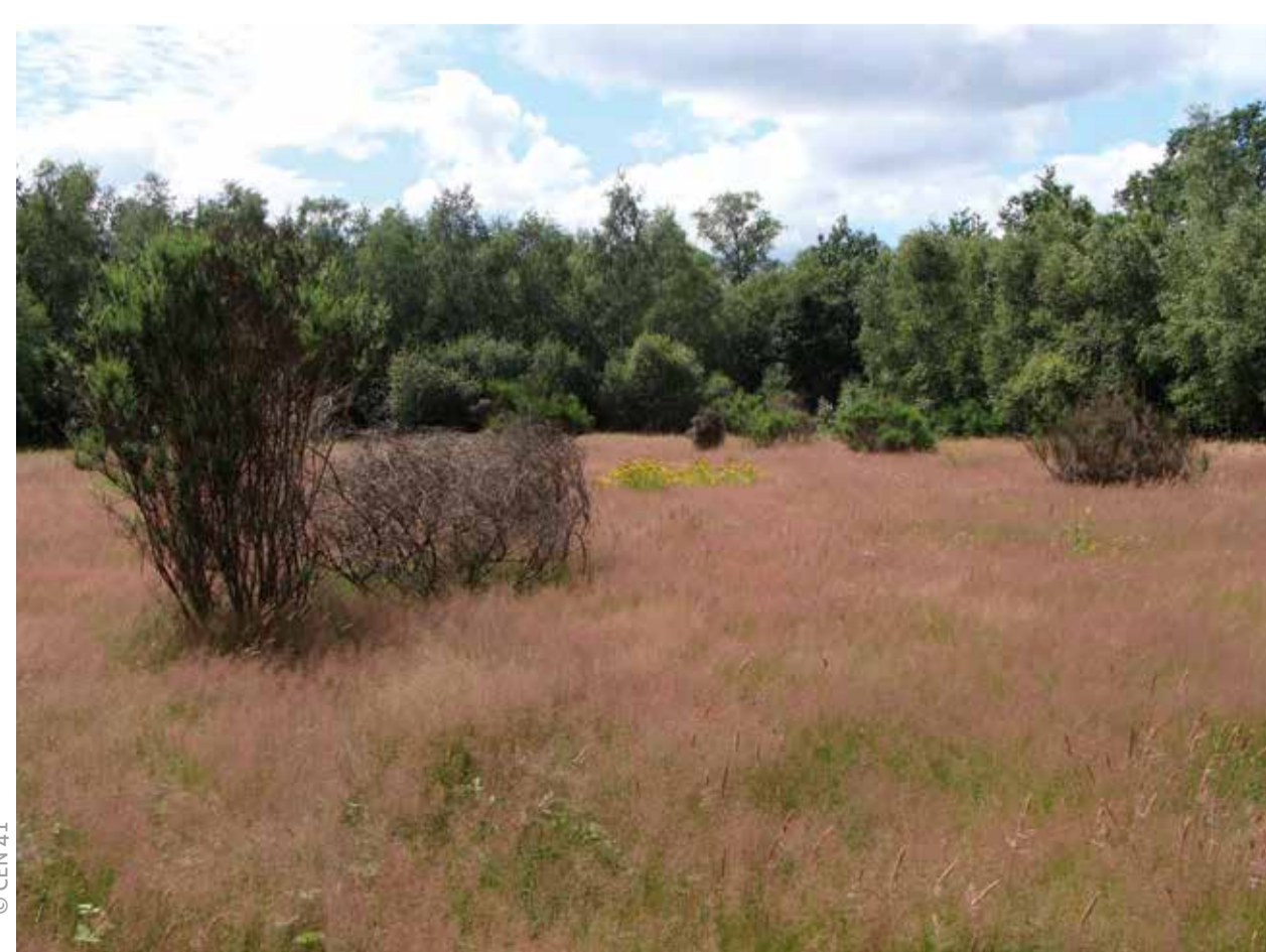
Lande à genêts broyée