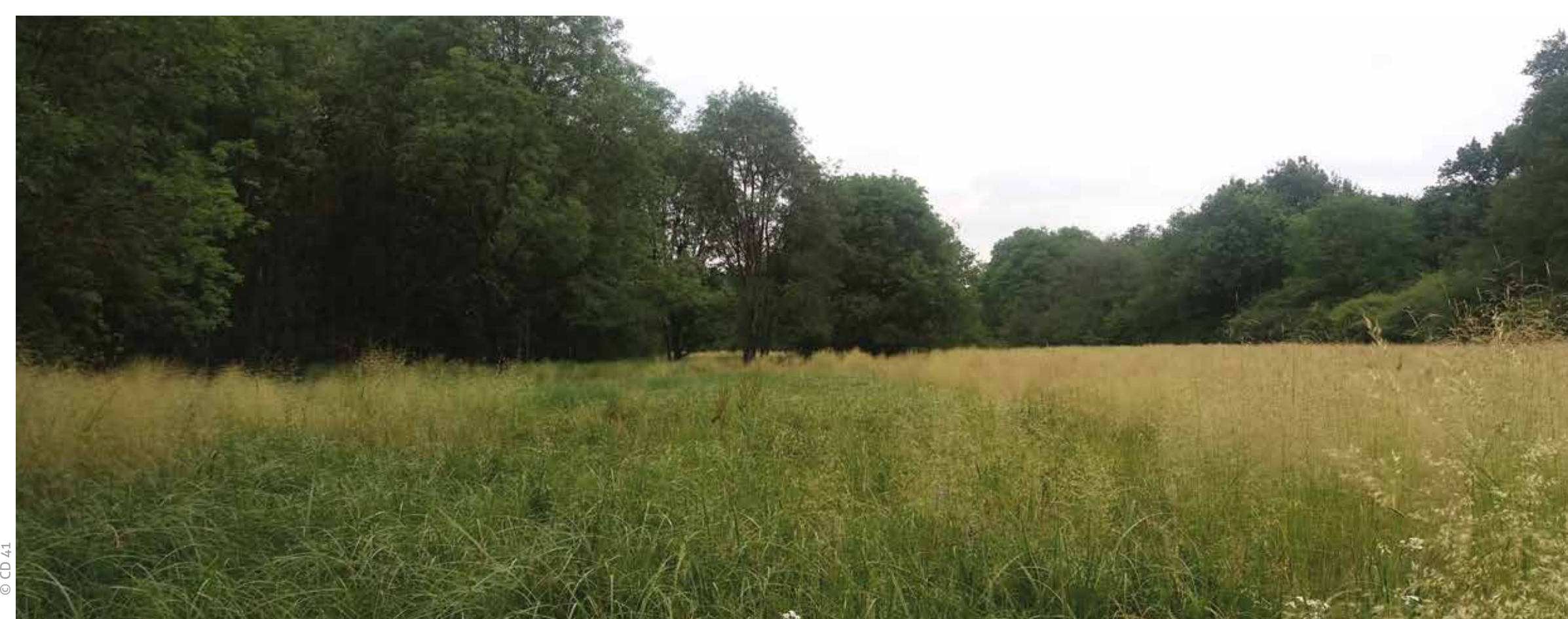
Prairie inondable en début d'été