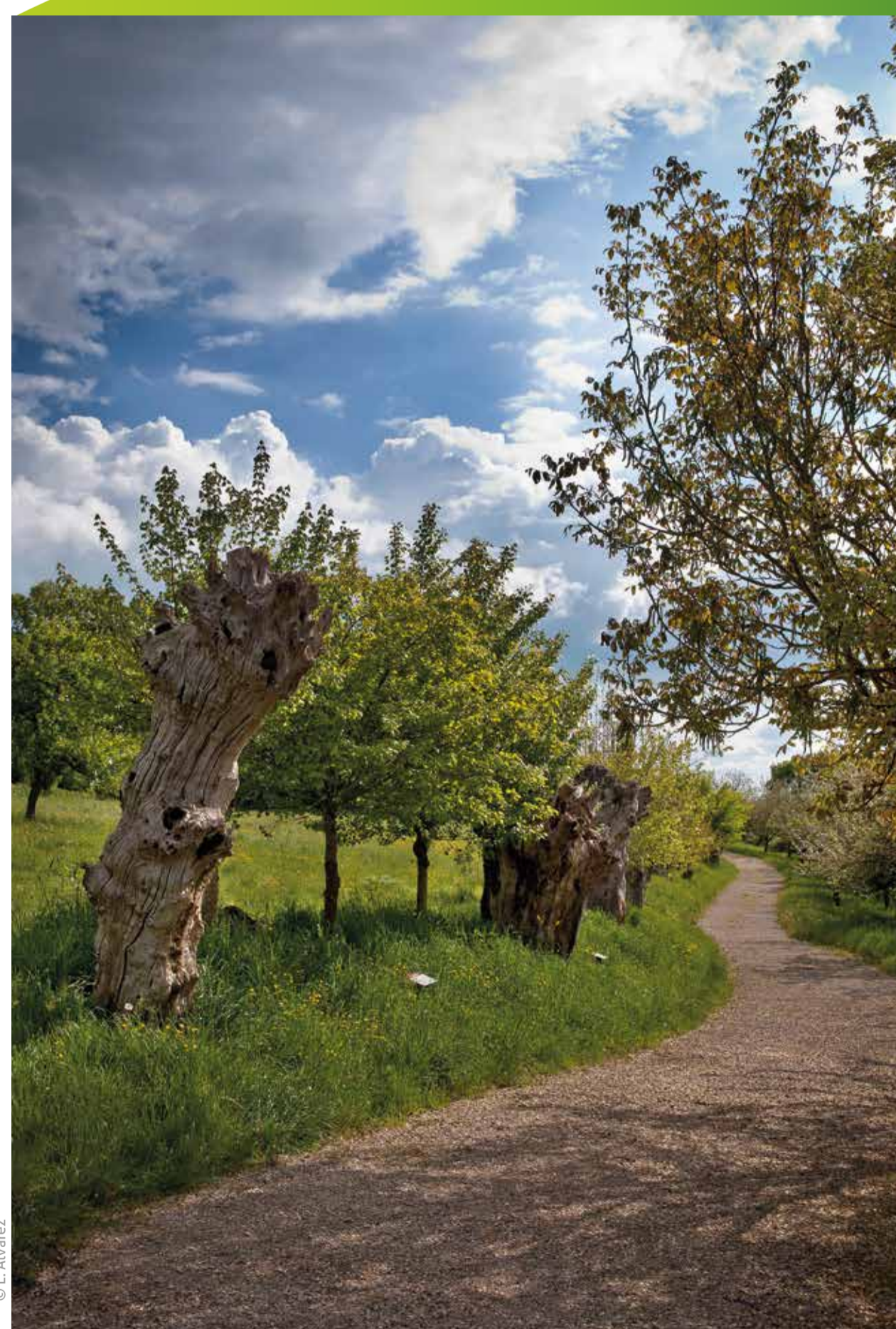
Chemin des trognés à Boursay

Au nord du Loir-et-Cher, le Perche Gouët offre un paysage vallonné encore façonné par le bocage. Haies, trognés, chemins creux, rivières, habitats dispersés marquent l'identité de ce terroir à la limite sud du Perche. Sur un parcours de 2,5 km dans la vallée de la Grenne, "Les trois chemins" offrent depuis la Maison botanique une découverte ludique, culturelle et botanique d'une grande richesse où les trognés, anciennes et nouvelles, sont notamment mises à l'honneur.