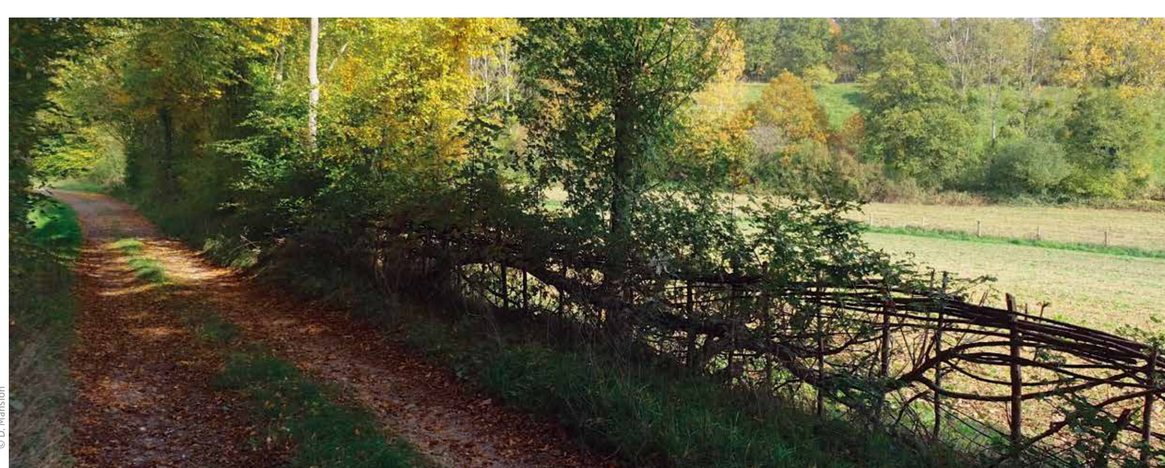
Plessage, chemin botanique