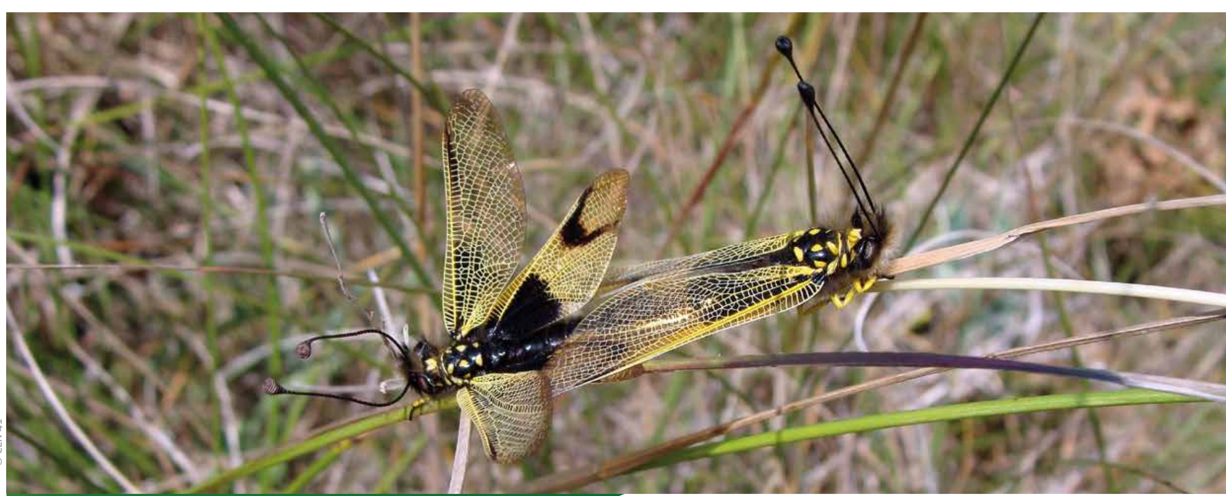
Couple d'Ascalaphes ambrés