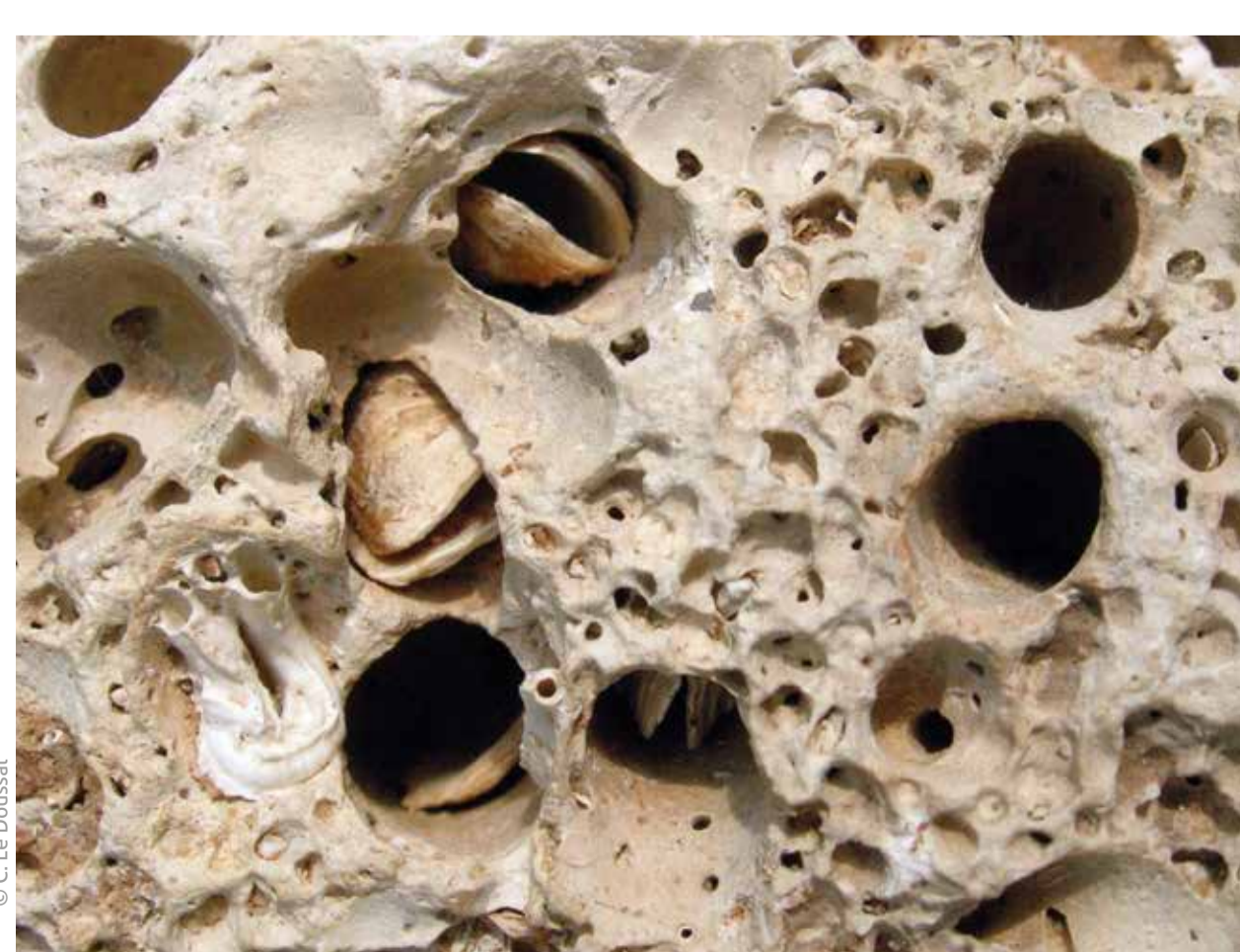
Calcaire perforé Pholades