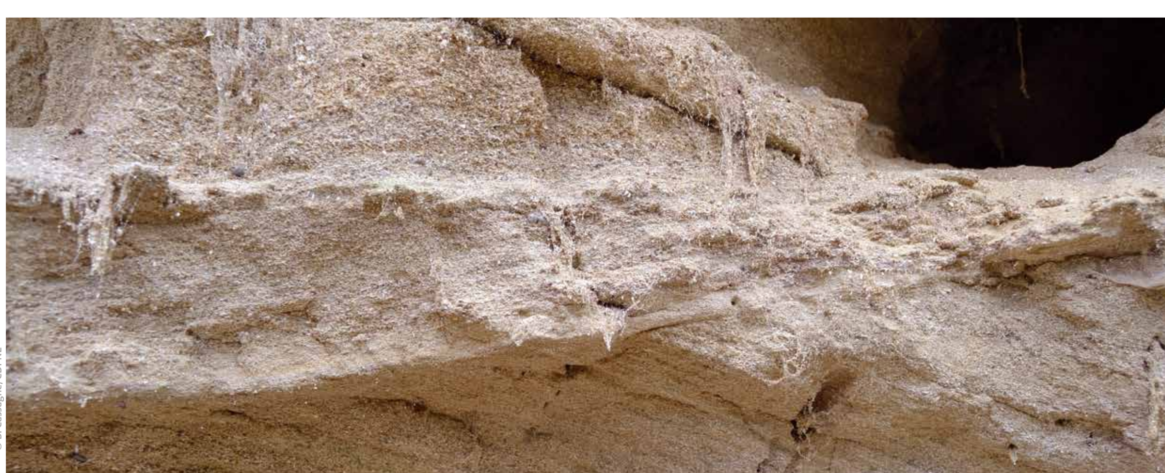
Falun du Blésois