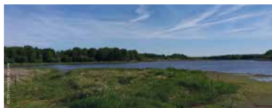
L'étang au printemps