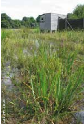
L'observatoire au cœur de la végétation aquatique

La Sologne est une vaste zone humide traversée par de nombreuses rivières et constellée de centaines d'étendues d'eau le plus souvent aux rives boisées. C'est un refuge incontournable pour les oiseaux hivernants et nicheurs. L'étang de Beaumont est un des rares sites naturels solognots dotés d'un observatoire accessible toute l'année et à tout public. La Sologne, ici, vous dévoile un peu de ses secrets que vous êtes invité(e)s à découvrir et à partager.